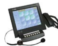
речевая информация цифровая, аналоговая, VoIP