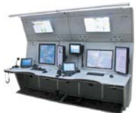
изображения экранов рабочих мест