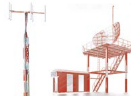
пеленгационная, РЛИ информация